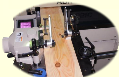
木端取りユニット