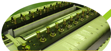
チップブレーカー前後