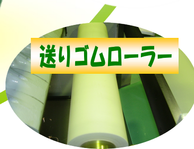
送りゴムローラー